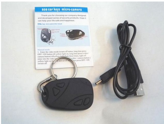
カメラ本体・説明書・USB ケーブル